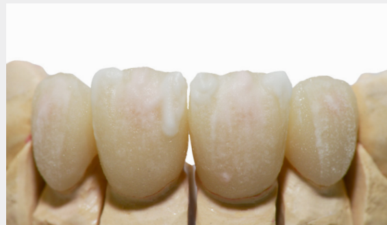
Individualisierung mit Opal Effect 1, Dentin A3 und Mamelon light.