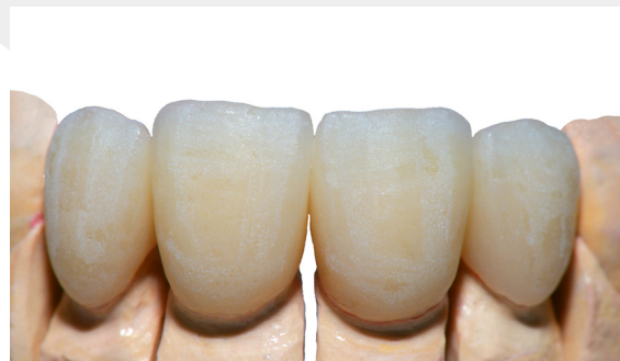
Ausarbeitung der Form und der Oberflächenstruktur.