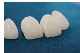
Fertige Kronen, bereit zum zementieren.