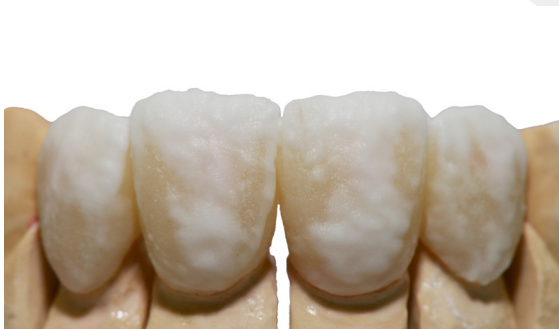
Schneideaufbau mit Transpa Incisal 2.