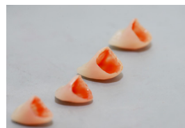
Ätzen mit Flusssäure (HF-Gel).