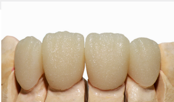
Wash-Brand mit Transpa clear, "Sprinkel-Technik". Verwendete Keramik: IPS e.max Ceram, Fa. Ivoclar.