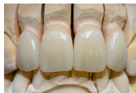
Kronen nach dem Malfarben- und Glasur- brand.