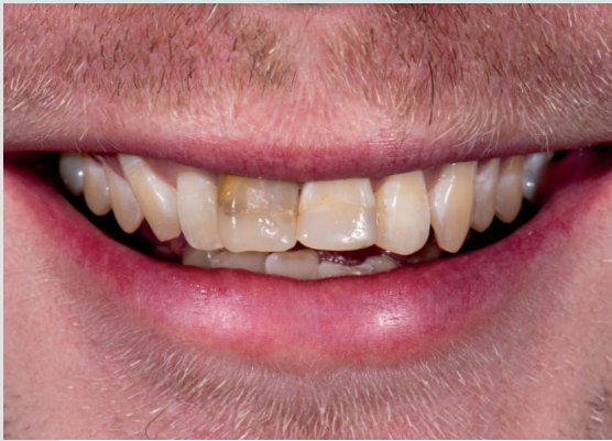
Stark verfärbte und deformierte Frontzähne 11 und 21.