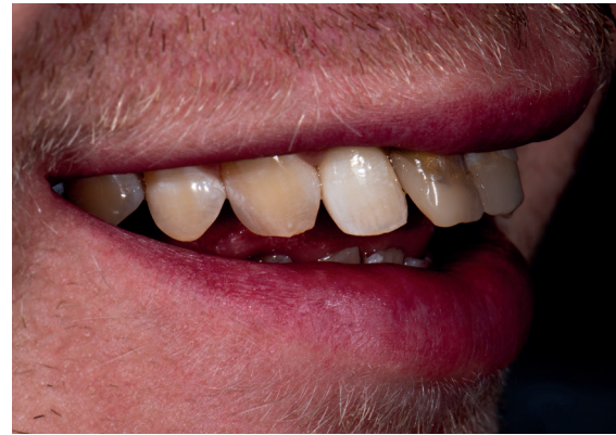
Wunsch des Patienten: Maskierung der Frontzähne 11 und 21 mit Kronen.

Farbbestimmung mit eLAB (Co. Emulation S.Hein)