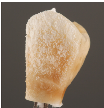
Interne Bemalung und Washbrand mittels "Sprinkeltechnik".