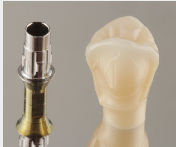
Perfektes Sinterergebnis. Ausgezeichnete Passung. Hervorragender Farb- und Transluzenzverlauf.