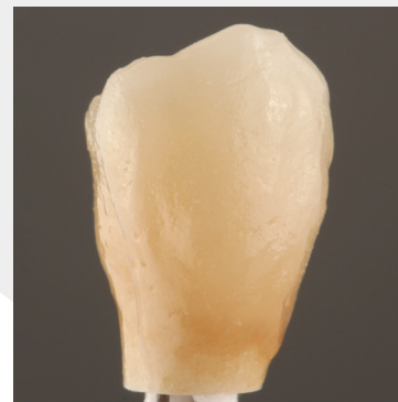
Fertige vestibuläre Verblendung mit ZI-CT von Creation.