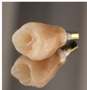
Fertig verklebte Restauration.