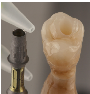
Verklebung zwischen Restauration und Titanbasis mit Multilink Hybrid Abutment von Ivoclar.