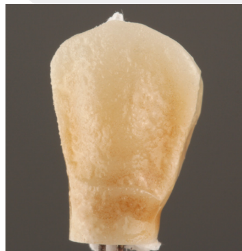
Ergebnis nach dem Washbrand.