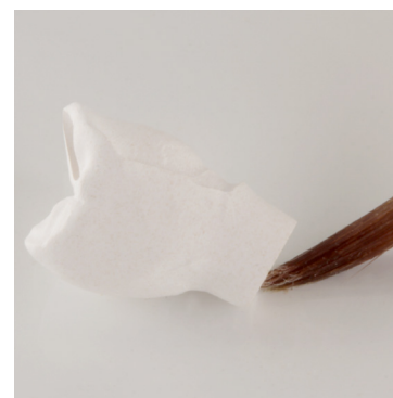
LightBlock Liquid auf die Restaura-tionsinnenseite auftragen.