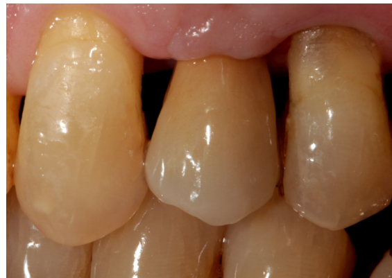
Ästhetisches Endergebnis in der Mundhöhle.