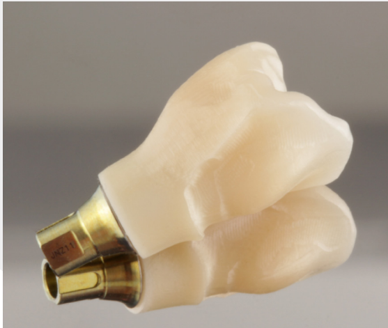
Restauration nach dem Sintern.