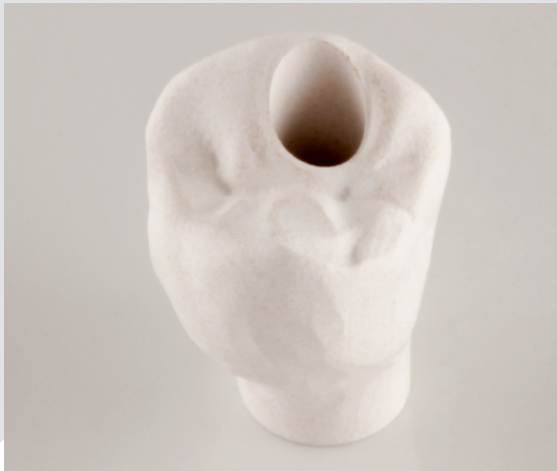
Herstellung der NexxZr T Multi Restauration.