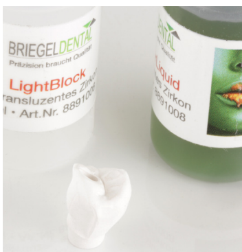
Zum opakisieren des Zirkoniumoxids an den Klebestellen kommt das Opakerliquid LightBlock von BriegelDental zum Einsatz.