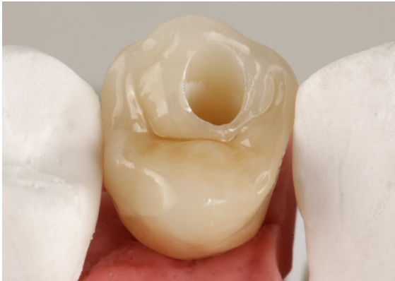
Fertige Restauration von okklusal.