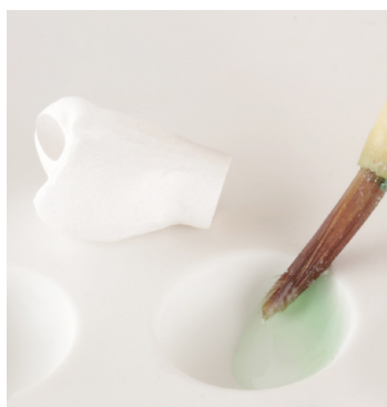
Liquid und Aktivator schütteln und zu gleichen Teilen, Verhältnis 1:1, mischen.