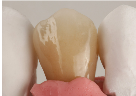
Fertige Restauration von vestibulär.