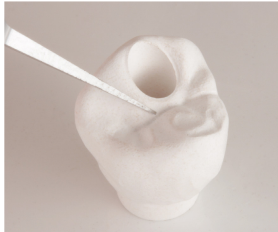
Manuelle Nachbearbeitung der Fissuren mit einem Vierkantfräser.