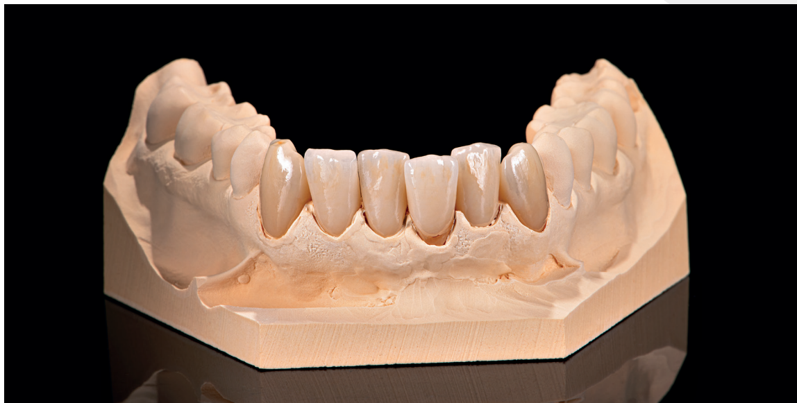
Schöne Farbeinstellung und gute Übereinstimmung zum Farbschlüssel.