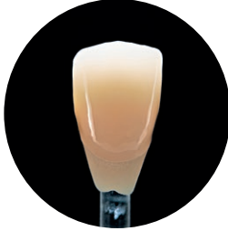
Gerçeğe uygun ışık geçirgenliği geçişi

Servikal alanda iyi kapsam ve insizal alanda daha yüksek ışık geçirgenliği