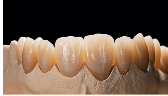
Yüksek ışık geçirgenliği