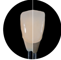
Servikal alanda iyi kapsam